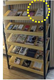
観光情報ラック (A4チラシ)

レジャー施設や宿泊施設、飲食店など、ご加盟店の業種・業態に合わせて販促物を企画・制作し、皆様の店舗までお送りします。 販促物はすべて弊社でご用意します。