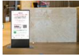
エントランス (サイネージ)