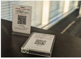
クリスタル (二次元コード)