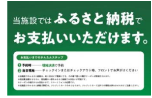
予約サイト (バナー素材)