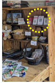
商品陳列棚 (L型スタンド)