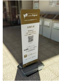
屋外用販促 (立て看板)