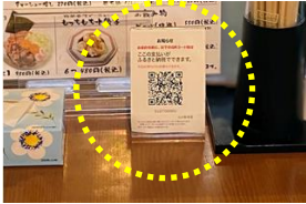
テーブルスタンド (二次元コード)