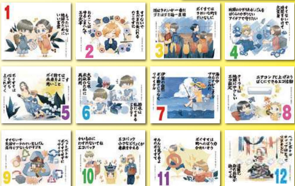
◎環境標語カレンダーは無料配布しています。ご希望の方は商工会本所・各支所窓口までお越しください。

本研究会では、ペットボトルのキャップを集めて世界の子どもたちにポリオワクチンを届ける運動にも積極的に取り組んでいます。商工会本所・各支所にてキャップの回収をしておりますのでご協力をお願いいたします。