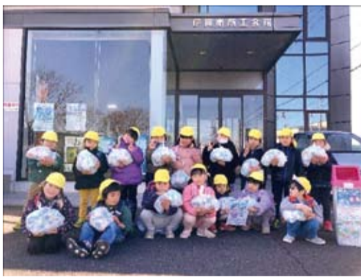
西柘植保育園の園児の皆さんが集めたキャップを商工会へ持ってきてくれました

商工会本所・各支所にてキャップの回収をしておりますので、ご協力をお願いいたします。一人でも多くの方がエコ活動を実践していただければと思っております。